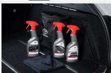
Zestaw kosmetyków samochodowych Toyota Kosmetyki